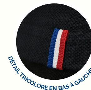
DÉTAIL TRICOLORE EN BAS À GAUCHE.